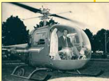
Sopra: La Madonna arriva in elicottero e viene accolta solennemente dai fedeli nella piazza di Alessandria (1959).

C'è stato un «patto di alleanza» fra la SS. Vergine e la Patria, che non sarà mai spezzato.