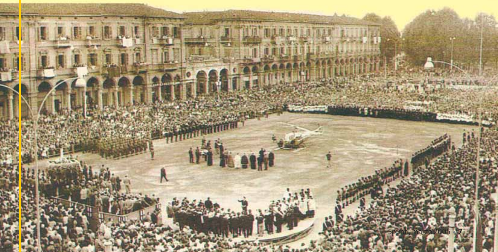
Sotto: Durante la Pellegrinatio Mariae del 1959 la Madonnina di Fatima ha visitato le principali città d'Italia. Qui vediamo il suo arrivo a Genova.