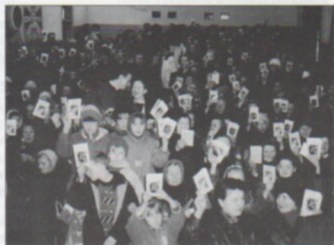
I fedeli, felici di aver ricevuto dal rappresentante di "Luci sull'Est" il libro su Fatima ed il Libro della Fiducia

Sì, perchè, se ai giorni nostri in Sudan, Egitto o altri paesi africani hanno luogo veri martirii, per quale motivo non dovremmo immaginare che durante tutto il duro regime comunista possano esservi stati uomini o donne uccisi in odio alla fede? Ed i testimoni non mancano, basta chiedere ed ascoltare.