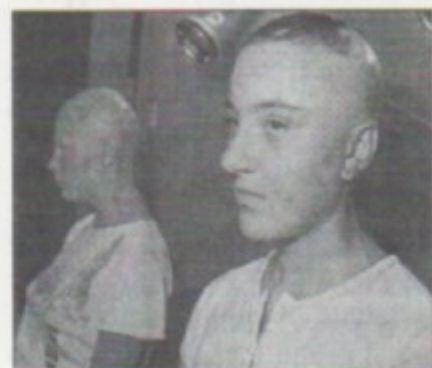
Due ragazze vittime delle radiazioni di Chernobyl

Sono passati nove anni, ma la verità sul disastro nucleare di Chernobyl non è stata ancora rivelata. In Occidente le prime notizie del grave incidente trapelarono attraverso i paesi scandinavi e subito dopo Gorbaciov, per la prima volta, interruppe la prassi di nascondere tutto ciò che accadeva nell'URSS e decise di far conoscere al mondo quanto era successo. E non poteva fare altrimenti perchè in quella occasione i sovietici furono costretti ad accettare l'aiuto occidentale. Le cifre ufficiali parlavano di 30.000 morti, ma ora si parla addirittura di 120.000, mentre 6.000 sono le vittime tra i primi soccorritori che avviarono le operazioni di contenimento e di bonifica dell'immediato territorio. L'incubo nucleare continua perchè in Ucraina ed in altre zone dell'ex-Unione Sovietica funzionano tuttora 57 centrali nucleari che gli esperti definiscono a rischio.