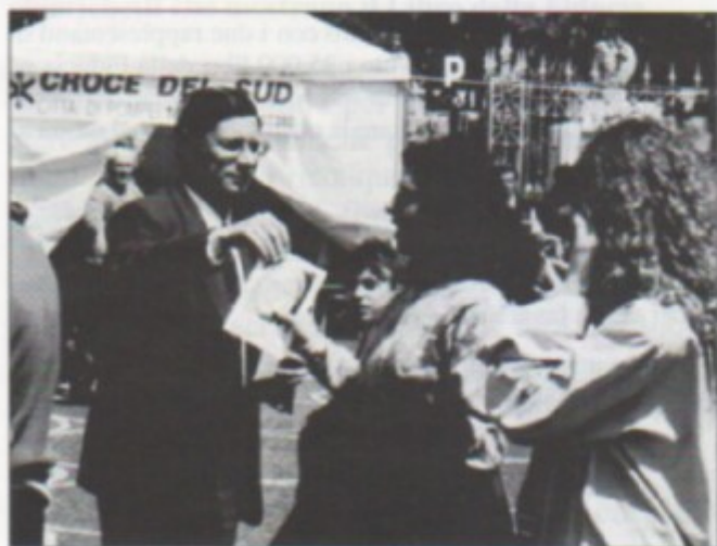
Distribuzione dei tagliandi di adesione a Pompei

Ed inoltre: Reggio Calabria, Placania (RC), S. Francesco di Paola (RC), S. Ferdinando (RC); Catanzaro; Padova; Vicenza; Verona; Treviso.