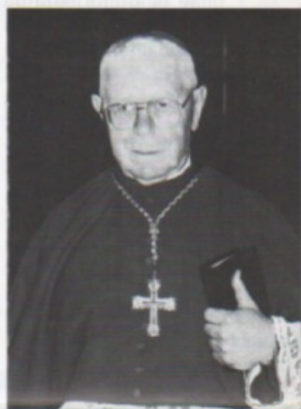
L'Arcivescovo Mons. Custódio Alvim Pereira, patrono della campagna “L'Italia ha bisogno di Fatima”

e di aperto plauso per questa iniziativa, di cui trascriviamo di seguito alcuni stralci: