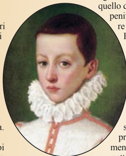
S. Luigi Gonzaga

«È grave errore dei giovanetti quello di supporre che la penitenza si debba praticare soltanto dai peccatori. Essa invece è necessaria anche per conservare l'innocenza. Se il Gonzaga [san Luigi Gonzaga] non l'avesse praticata, sarebbe forse caduto in qualche peccato grave. Questa verità si dovrebbe quindi predicare e costantemente insegnare ai giovanetti. Quanti di più conserverebbero l'innocenza,