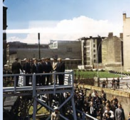
Il presidente Kennedy mentre visita il muro.

L'11 febbraio 1990, l'intellettuale e leader cattolico brasiliano Plinio Corrêa de Oliveira pubblicò lo studio «Comunismo e anticomunismo alle soglie dell'ultima decade di questo millennio», apparso sul Corriere della Sera , Wall Street Journal , Folha de S. Paulo , Il Tempo e molti altri giornali e riviste.