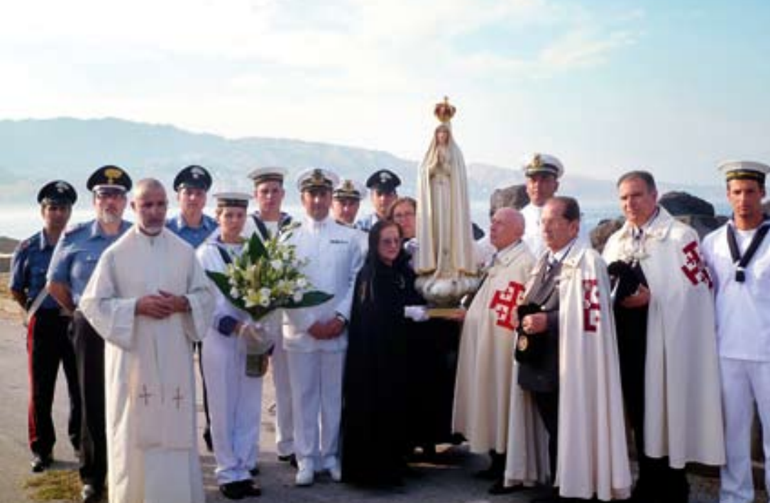
MESSINA. A sinistra, il Comandante del Distaccamento della Marina Militare (Messina), altri ufficiali e membri dell'Ordine del Santo Sepolcro posano con la Madonna pellegrina di Luci sull'Est .