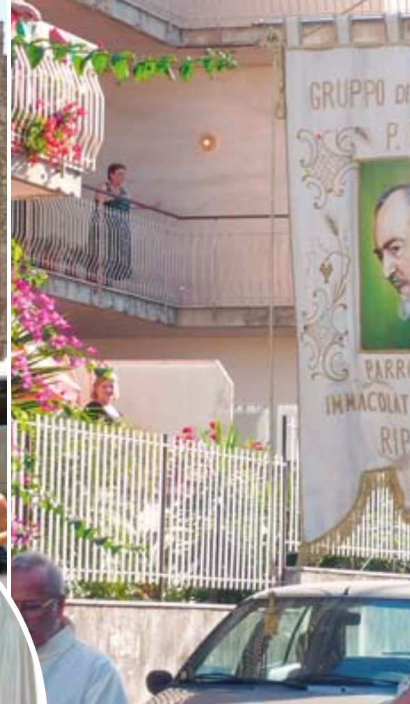
RIPOSTO. A sinistra, il materno sorriso della Santissima Vergine solleva il dolore e lo sconforto dei degenti.