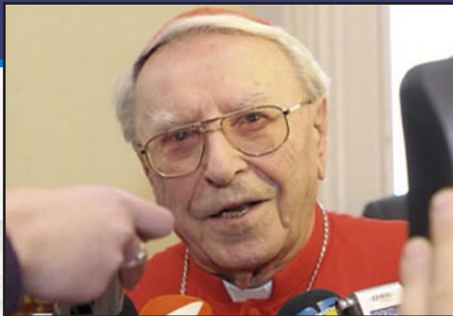
Il cardinale slovacco Ján Chryzostom Korec.

Di recente, i nomi di due anziani cardinali – martiri del comunismo – sono tornati sui titoli dei giornali. Si tratta dello slovacco J.C. Korec e del bielorusso K. Swiatek, recentemente deceduto nella città di Pinsk, della quale era stato prima vescovo e dopo amministratore apostolico. Ricordarli è un'opera di giustizia in un tempo in cui si tende a dimenticare i misfatti del cosiddetto socialismo reale, fra i quali spicca la feroce persecuzione anticristiana.