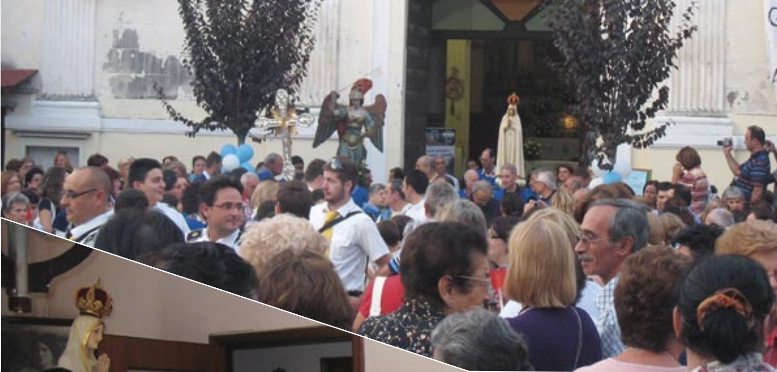
Somma Vesuviana (NA)