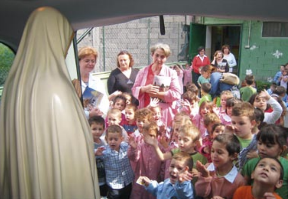
Piano Tavola (CT)