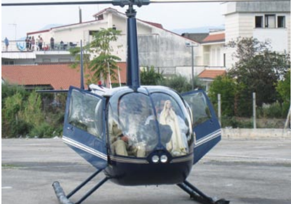
Somma Vesuviana (NA)

A volte capitava che la professoressa tardasse, allora iniziavo a recitare il rosario insieme ai miei compagni. Se lei arrivava al terzo mistero non ci interrompeva ma continuava a pregare con